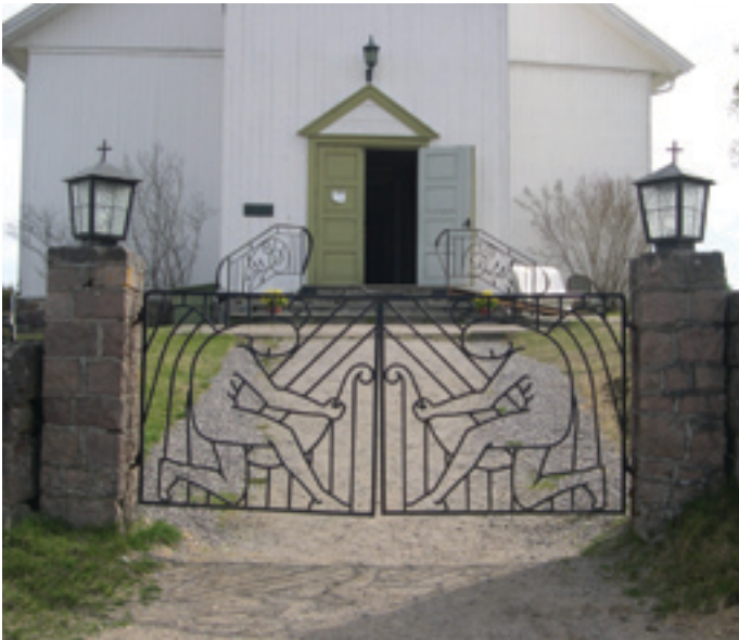
Både hovedporten og de 2 mindre portene fikk enkle og vakre motiver

Det ble så bra med sol i Påsken at ingen brydde seg om å effektivisere solinga, så derfor heller intet skrapelodd.