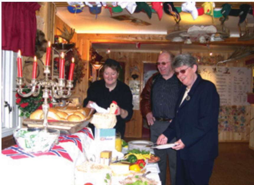
Et pyntet bord med herlige frokostretter ventet de besøkende på Pizza`n

Han kom også inn på den økende vold mot kvinner og Martin Luther King, Nelson Mandela og Desmond Tutus kamp for de fargedes borgerrettigheter.