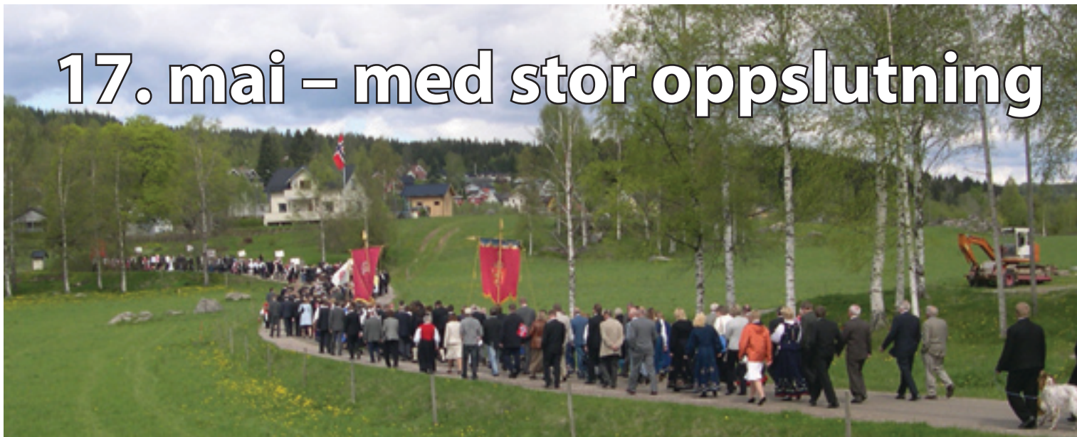
Tidens lengste 17. mai tog på Austmarka