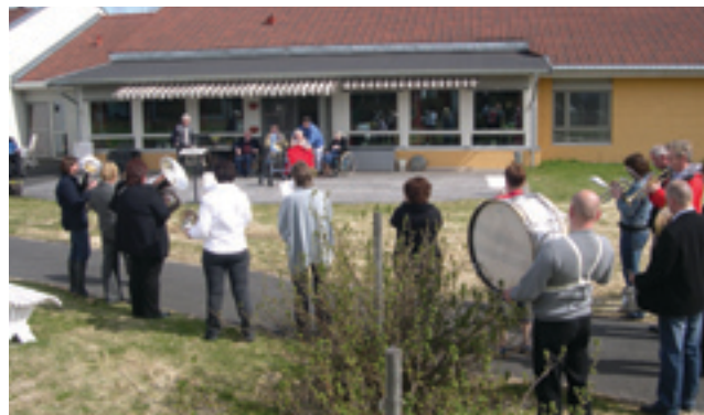
Pasientene på sjukestua satte pris på den fine musikken