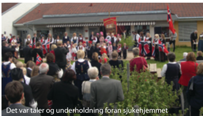
Det var taler og underholdning foran sjukehjemmet