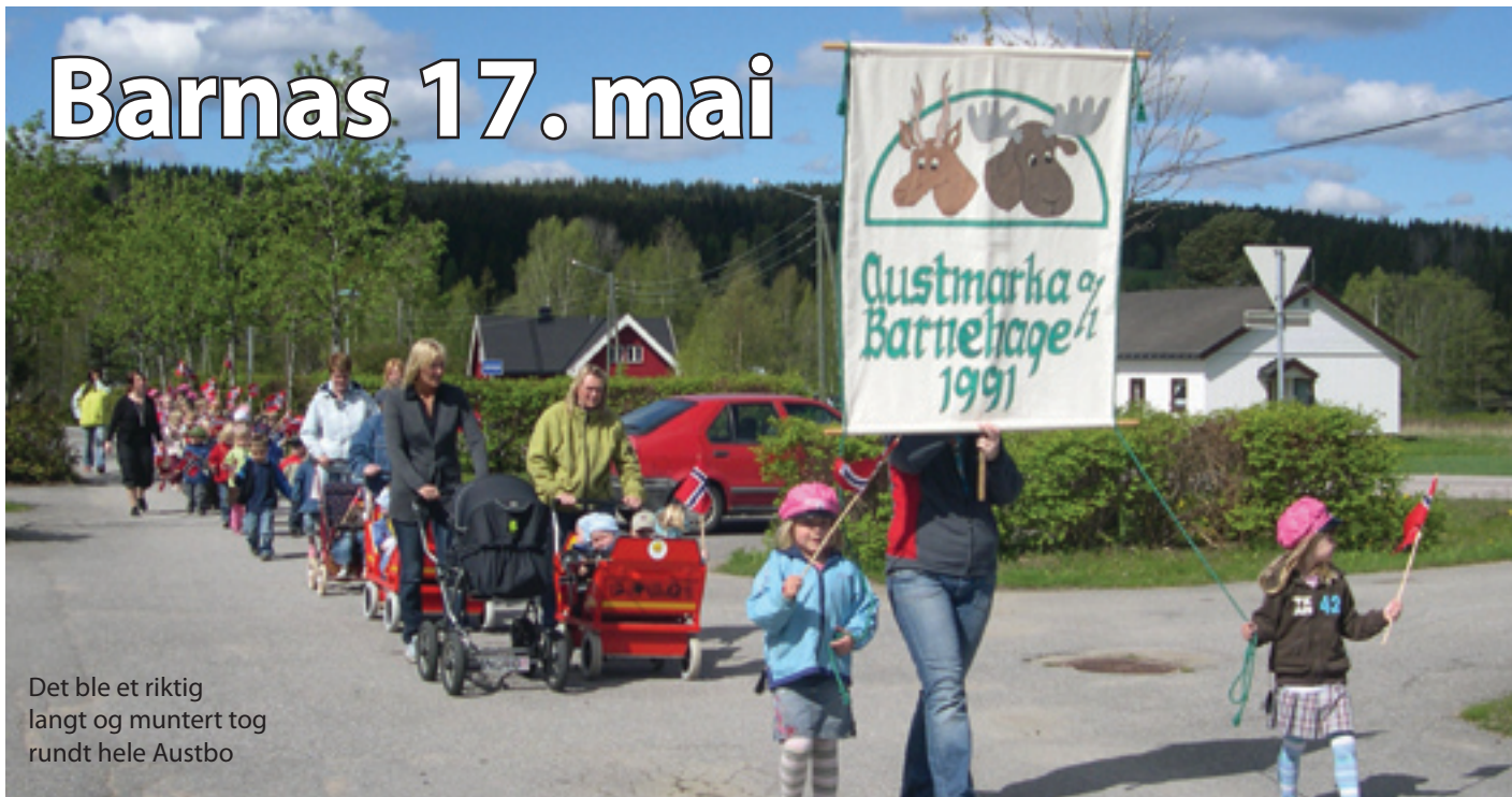
Det ble et riktig langt og muntert tog rundt hele Austbo

For barnehagen er det dagen før dagen som er den store. Da møter barna opp til tog, festmåltid og mye moro. I barnehagen på Austbo er det nå 51 barn, så det blir et godt synlig tog når de kommer trillende og marsjerende, alle med norske flagg og muntre hipp hurra rop.