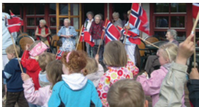
Barna underholdt med fin sang for de eldre på Austbo.