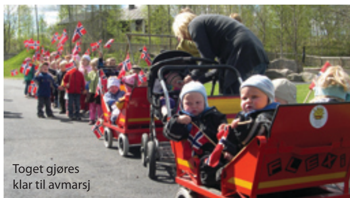
Toget gjøres klar til avmarsj

russen oppgaver som kvalifiserte til knuter og ting til å henge på snoren til russelua. Etterpå gikk det stolte småruss omkring med både seimenn, binders og knuter i lua. Med pølser, brus og leker ble dette en riktig festdag for de minste. Bedre kan det ikke bli i barnehagen.