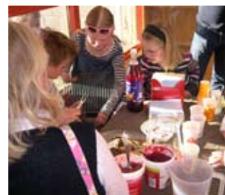
Etter all trolldom smakte det godt med “finnemat”.

1.-2. og 3. klasse hadde satset på trolldom og over-