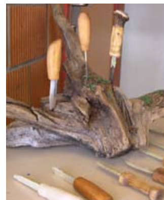
Mot trolldom hjelper bare stål. Best å være forberedt, tenkte noen elever og satte i gang med knivproduksjon.

tro og fortalte den ene nifse historien etter den andre. Vi fikk også høre om trollmenn og Svartebokas magi og om Haltegutten som solgte sin sjel til Puken for å lære å spille fele. Ja, her var nok av både overnaturlige og underjordiske vesener, tusser og troll, slike som bare stål biter på.