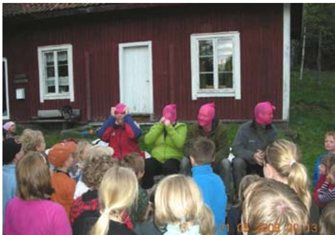
Elevene koste seg over de voksnes lek på Lebiko.

foreldrene måtte gjennom en morsom lek, til fryd for hele elevskaren. Rosignalet gikk kl 22.30 og da var de fleste så slitne at det var godt å komme seg i soveposen. Noen valgte å sove ute i lavvo eller telt, mens andre sov inne på Lebiko.