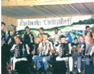
Alt er klappet og klart for et vellykket Trekspilltreff.

– Ettersom det er 25-årsjubileum i år, har vi satset litt ekstra på profesjonelle underholdningsartister, sier Jahnsrud og Torp.