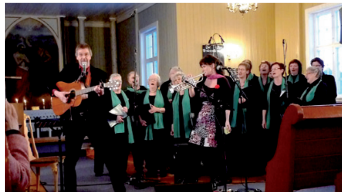
Austmarka Bygdekor bidro til en trivelig sang- og musikkopplevelse i kirken.

Marnstuen Media AS støtter Austmarkingen med layoutproduksjon og trykk.