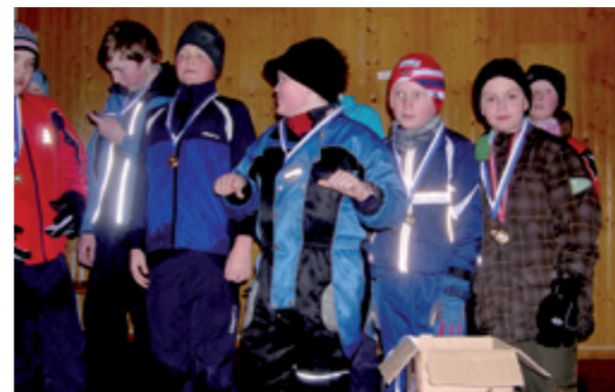
Pallen til AIL har plass til alle. Her er det medaljeutdeling til deltakerne av Jubileumsrennet 2010.

I 1960 hadde Idrettslaget 35 betalende medlemmer pluss en Ungdomsgruppe på 20. Men det var bare i Miniatur-gruppa at damene fikk være med. Det var ennå ingen grupper eller klasser for jentene i andre konkurransene. Men i festkomiteen fikk de lov å vise sine ferdigheter. Økonomisk var det dansefestene, vanligvis 10 i året, som stort sett sørget for inntektene.