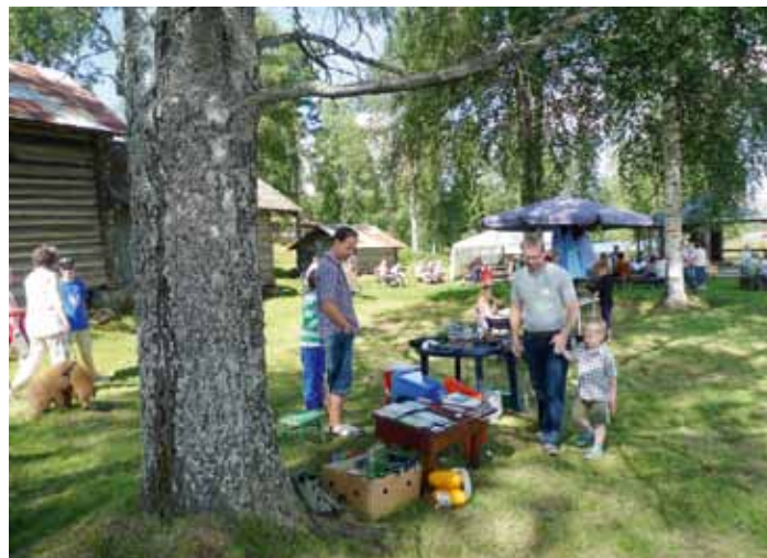
På barnas eget loppemarked var det god omsetning av brukte leker.