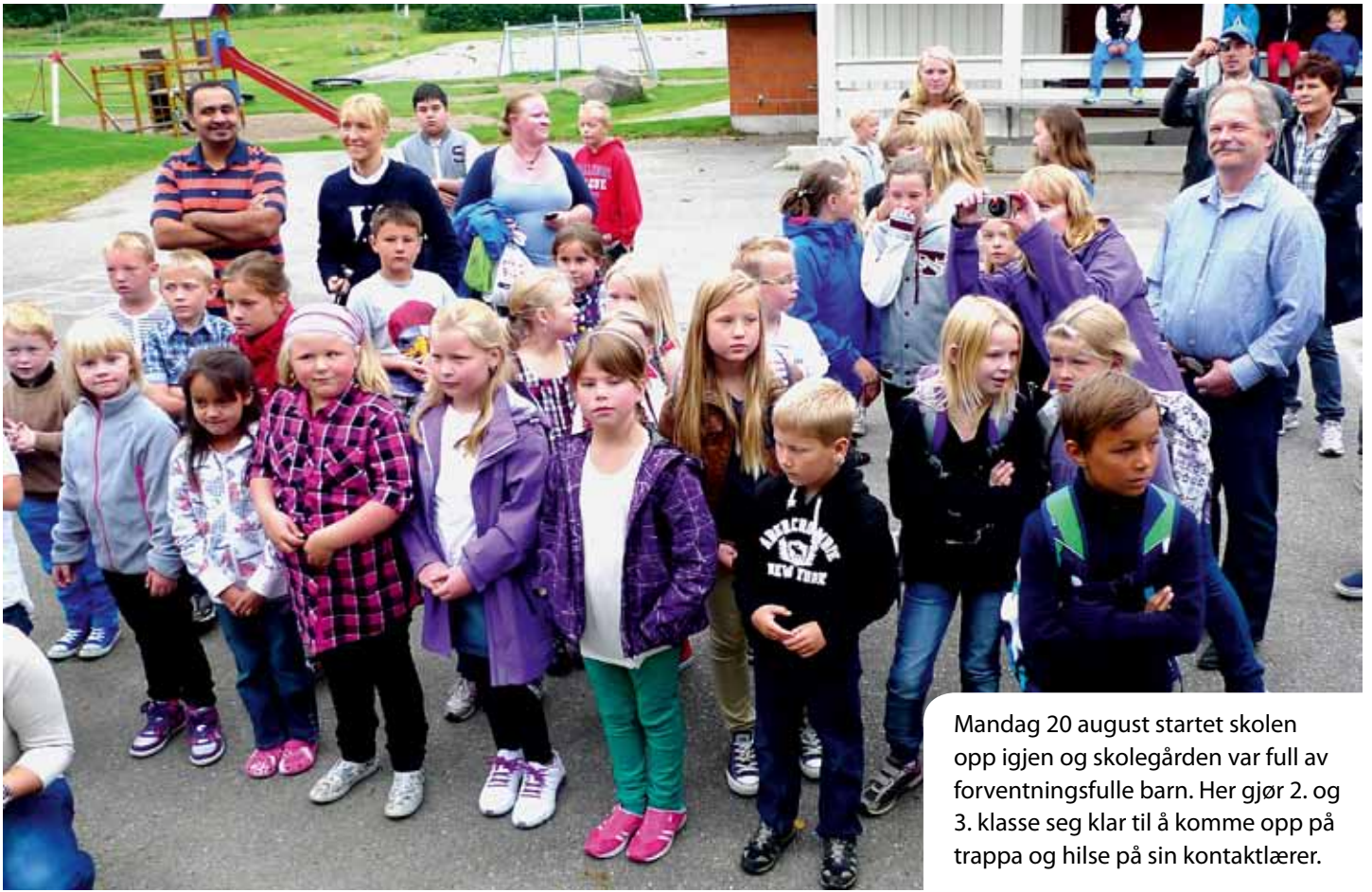
Mandag 20 august startet skolen opp igjen og skolegården var full av forventningsfulle barn. Her gjør 2. og 3. klasse seg klar til å komme opp på trappa og hilse på sin kontaktlærer.